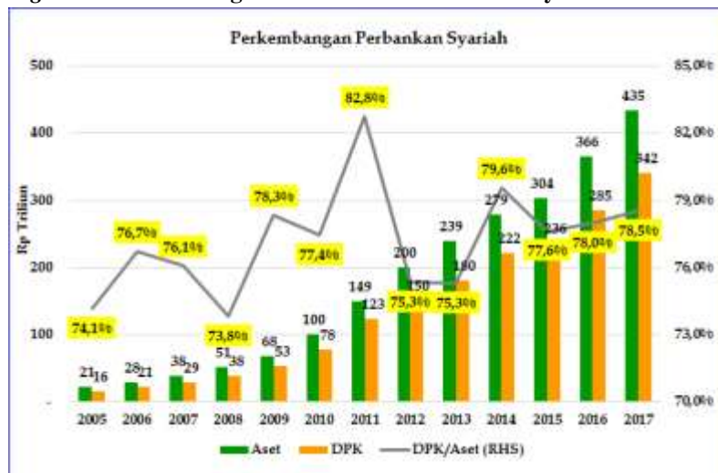
Figure 1: Perkembangan Aset & DPK Perbankan Syariah

Perkembangan perbankan syariah menunjukkan sampai dengan akhir tahun 2017 tercatat aset mencapai sebesar Rp435 triliun dengan Dana Pihak Ketiga (DPK) mencapai sebesar Rp342 triliun. Secara umum, DPK di perbankan syariah serupa dengan di perbankan konvensional yang tersedia dalam bentuk Giro, Tabungan, dan Deposito. Yang membedakan dengan perbankan konvensional adalah perbankan syariah menggunakan akad dalam setiap penghimpunan dananya. Terdapat 2 akad dalam penghimpunan dana di perbankan syariah, yaitu: akad wadiah dan akad yang menjadi mayoritas dalam penghimpunan dana yaitu akad mudharabah .