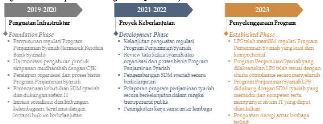
Figure 13: Fase Implementasi Program Penjaminan Syariah

Tujuan akhir ( end state ) dari cetak biru penjaminan syariah adalah tercapai Penjaminan Simpanan Nasabah Bank Berdasarkan Prinsip Syariah yang efektif, handal dan mapan di tahun 2023. Dasar pemilihan tahun 2023 adalah pada akhir tahun tersebut menjadi batas waktu UUS dapat beroperasi sebagaimana ditetapkan melalui UU Perbankan Syariah yaitu 15 tahun sejak UU tersebut diberlakukan. Untuk mencapai tujuan akhir tersebut proses implementasi penjaminan syariah akan dibagi menjadi 3 fase yaitu: (i) foundation ; (ii) development ; dan (iii) established ; dengan masing-masing rencana kerja pada setiap fase dijelaskan dalam figure di bawah ini.